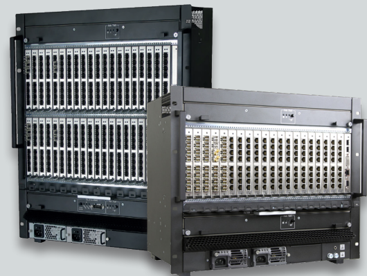
Das Draco tera Matrixsystem. Erhältlich in einem Größenspektrum von 8 bis 576 Ports.